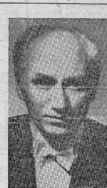
El Dr. Karl Krueger, director de la Orquesta Sinfónica de Detroit, Estado de Michigan.